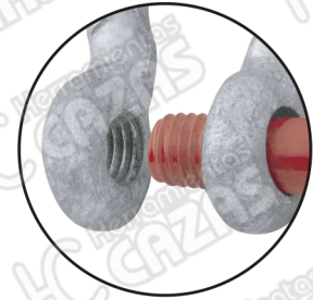
PERNO TIPO ROSCA